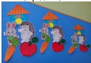
Дидактическая игра «Большой, средний, маленький»